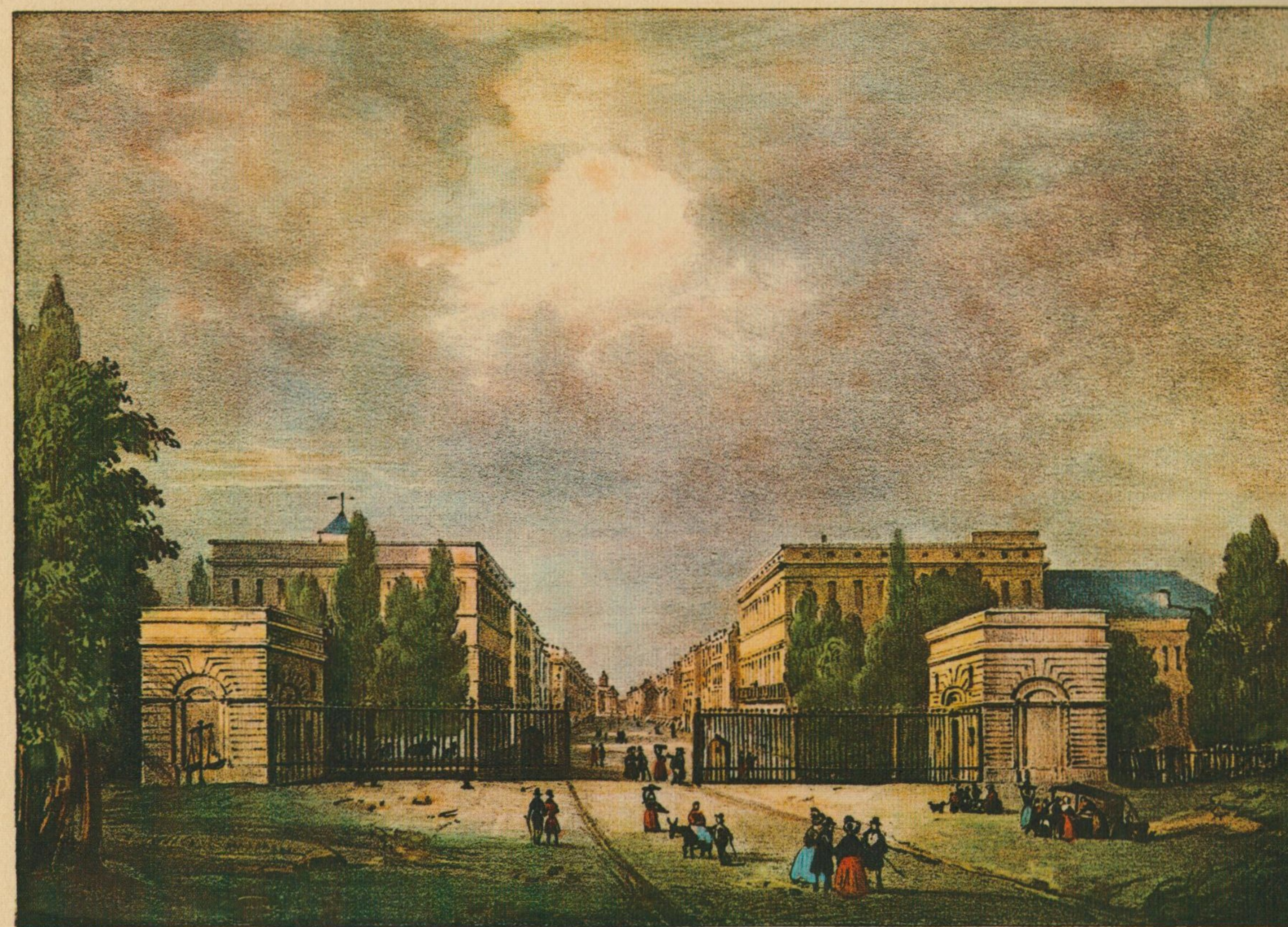
Vue de la Porte de Schaerbeek